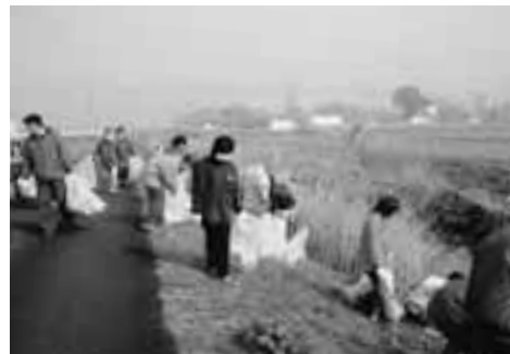
平成17年3月 綾瀬川清掃実施状況

作業内容 綾瀬川の境橋から別所橋までの7.5kmの間で、河川敷内に散乱したゴミの回収（粗大ゴミは除く）。