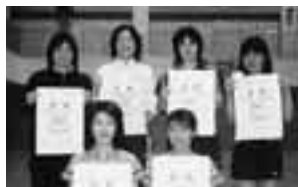
女子の部(入賞者のみなさん)