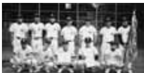
優勝 Aクラス サクラ

Aクラス 優勝 サクラ(4勝) 2位 國士無双(2勝1敗1分) 3位 マジックリン(2勝2敗) 4位 EASTグッピーズ (1勝2敗1分) 5位 空海(4敗)