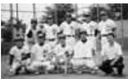
メガジャイアンツ