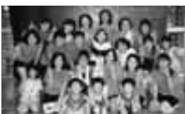
シャイニングスカイ