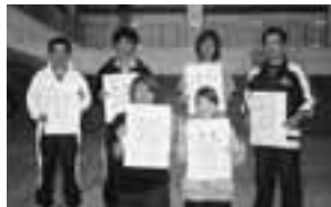
Bブロック(入賞者のみなさん)