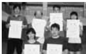
Cブロック(入賞者のみなさん)