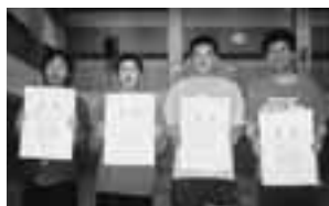
Aブロック(優勝、2位のみなさん)