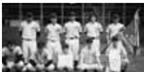
優勝 Bクラス オール伊奈