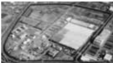
親しみやすい名称を(処理センター全景)

(申込) 〒330-9301 さいたま市浦和高砂3-15-1 FAX 048-830-4884 E-メール a5440@pref.saitama.lg.jp 締切り 平成17年9月15日