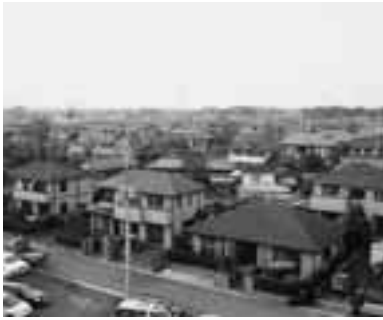
区画整理のようす

町の事業の一つとして、中部特定土地区画整理事業地内の宅地（保留地）を公売します。今回公売する宅地（保留地）は6区画で、伊奈中央駅から徒歩約6分圏内です。