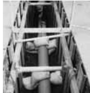
下水道工事のようす