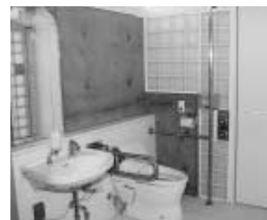
内部も使いやすく

昨年11月から、駅利用者には大変ご不便をおかけしていましたが、志久駅前にトイレが完成しました。このトイレは光の箱をイメージした洋風の造りで、男子・女子・多機能の3つに分かれ、子ども連れやお年寄り、体の不自由な方にも利用しやすいトイレになりました。