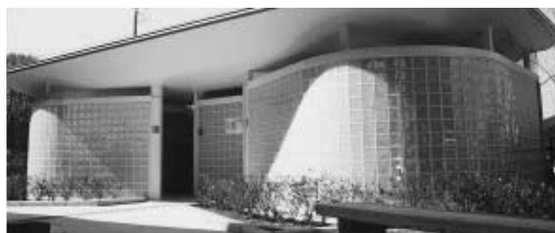
外観は光の箱をイメージした明るいつくり