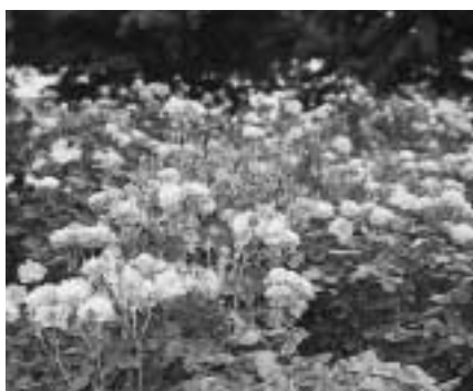
ご理解ご協力をお願いします

記念公園のバラ園が今年から有料になります。 昨年まで無料で開放していましたが、バラの管理費に充