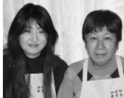
↑愛育会の仲間を募集しています。