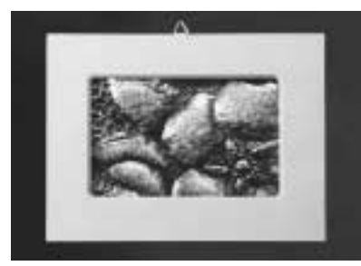
「花」花のふっくらとした感じを表現するのに苦労しました。