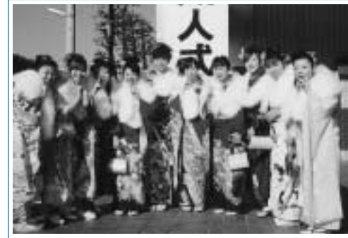
成人式 1月10日(祝) 10時より(9時30分から受付) 総合センター大ホール

高齢者の交通事故抑止の一環として、県から「交通安全まなび隊」を招いて、交通安全講話を行います。ふるってご参加ください。 日時 12月15日(水) 場所 老人福祉センター集会室 対象 60歳以上の方 定員 100名 問・申 総合センター事務室 ☎722-9111