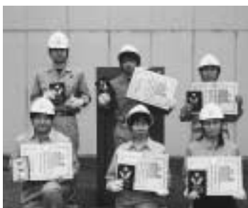
▲優秀選手賞受賞のみなさん