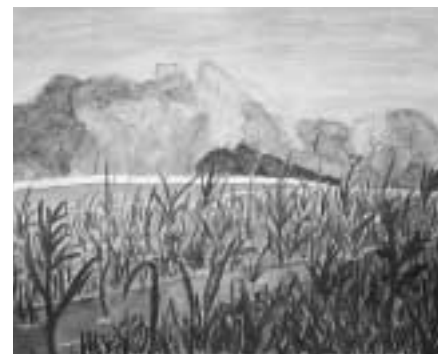
「綾瀬川のほとり」 草のいきいきとした感じを出しました。