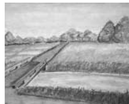
「綾瀬川」 春の日差しを表現しようと描きました。