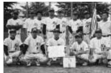
▲1部 メガジャイアンツ