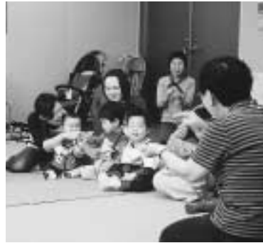
伊奈町コミュニティづくり 推進協議会