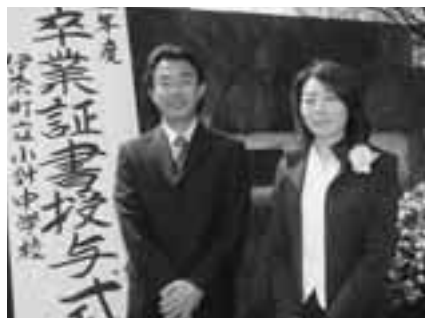
胸が熱くなる卒業式でしたね