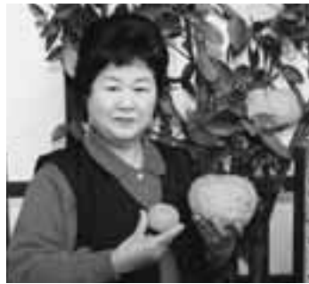
こんなに大きなゆずが実りました。(左のゆずは買ったもの)