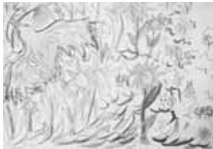
「幸せの青い鳥とひまわり畑」 鳥の羽根を描くところを工夫しました。