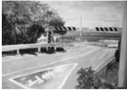
「ある夏の日」 1番気に入っている道を描きました。