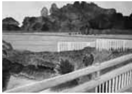
「橋の上から」 草の1本1本を描くのが大変でした。