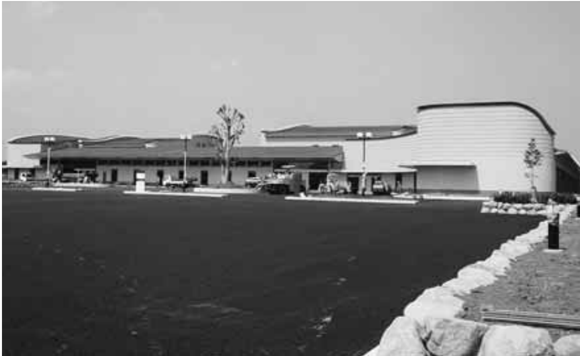
オープンを待つ「上尾伊奈斎場」つつじ苑

11月1日(土)、長年の念願でありました「上尾都市計画火葬場」が供用開始することになりました。