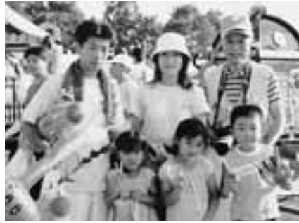
笑顔でハイチーズ!