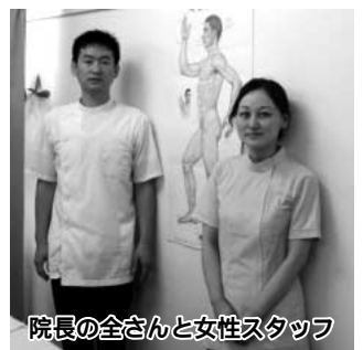
院長の全さんと女性スタッフ

上尾市役所前の「北京ソフト整体院」(株)全日では、中国の漢方医学の内気功と手技を取り入れた気功整体を用いて、身体の痛み、疲れを改善。紹介や口コミでの来院多数。「10数年来の腰痛です、時々痛みが強くなった時、整体をして頂いています。受けた後体が軽くなり、痛みは薄皮をはく様な感じで徐々にとれていく感じです。」(65歳主婦)腰痛、五十肩、老年性狭窄症、ヘルニア、膝関節疾患、肩こりなどに効果的。症状により数回の通院が必要。予約優先。無理やり回数券の販売はせず、誠心誠意の施術を心がけています。記事見た方、初回50分コース6千円が3千円に。9時~21時。HPは「上尾北京整体」で検索。☎048・771・9168 北京ソフト整体院はここだけ。似たような名称の整体院とは関係ありません。やり方が変わったので前に来られた方たちもよかったです。