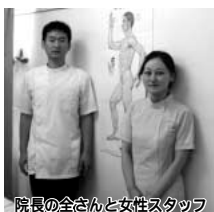
院長の全さんと女性スタッフ 上尾市役所前 株式会社北京ソフト整体院

ロコミで人気 ポキポキしない気功整体 「朝、腰の固まった感じがない!こんなことココ10年以上なかったんです!」「週末の頭痛がなくなり、楽しい日々が過ごせるようになりました。」「体が重たく、肩が凝って頭痛がひどかった。気がわるくなっては、吐いてしまうことも。今では、ウソのように体が軽いです!」「歪まない体作りとは?」「元気でいつまでも仕事ができる体作りを考え治療にあたります。無理やり回数券の販売せず、誠心誠意の施術を心がけています。」 初回50分コース:6千円が3千円に。 土・日・祝日は施術します。(定休日:水曜日) HPは「上尾北京整体」で検索。☎048-771-9168