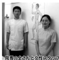
院長の全さんと女性スタッフ

ロコミで人気 ポキポキしない気功整体 症状に合わせた確かな施術で体の不調や疲れを改善。痛みのない整体です。腰痛、膝変形症、坐骨神経痛、五十肩等。他で改善されなかった方、ぜひ一度体験してみてください。当院は、痛みや不快症状を相手に、患者さんと共に戦っています。無理やり回数券の販売せず、誠心誠意の施術を心がけています。