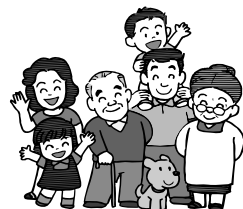
伊奈町コミュニティづくり推進協議会