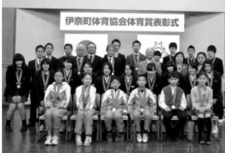
伊奈町体育協会体育賞表彰式

町体育協会では、地域、生涯スポーツの振興に貢献し、その功績が顕著な方およびスポーツ界で優れた技量を発揮し、優秀な成績をおさめ、他の模範となる方に対して体育賞をおくり、その栄誉を顕彰しています。敬称略