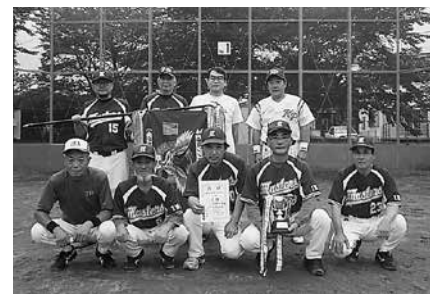
▲細田山マスターズ