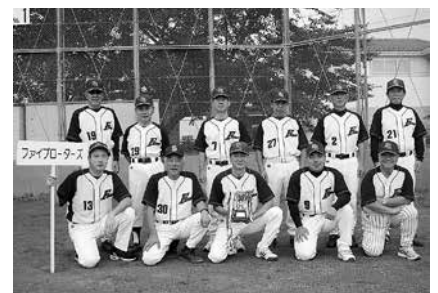
▲ファイブローターズ

Bブロック 優勝 ファイブローターズ 準優勝 栄カッターズ 3位 栄フォーメイツ