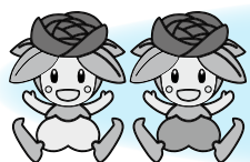
伊奈ローズちゃん、伊奈ローズくん

昨年の6月30日からはじまった伊奈町ふるさと応援寄付金に、日本全国からたくさんの寄付をいただきましたので、使い道別の申込件数と申込金額をご報告します。寄付者の皆様に、心よりお礼申し上げます。