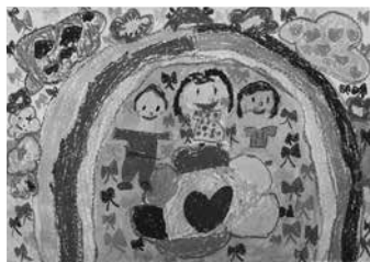
「にじいろのせかい」