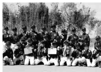
優勝 小針ヤンキーズ