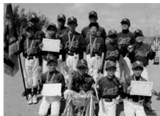
優勝 伊奈レッツファイターズ