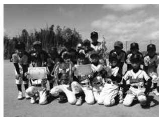
優勝 小針ヤンキーズ