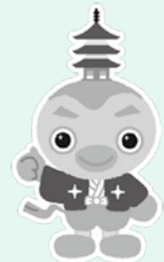
つくばみらい市のイメージキャラクター「みらいりんぞう」

※伊奈町とつくばみらい市は平成25年1月17日に「友好都市連携協定」を締結し、交流を重ねています。