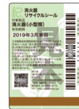
既製品用シール (見本)