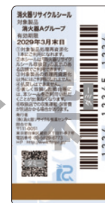
新品用シール (見本)

製品にはリサイクルシールが貼られています。消火器の使用期限が過ぎたら、取り扱い窓口へ引き渡してください。