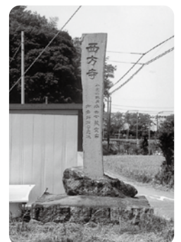
城跡は現在工業用地となっており、門に通じる道路の入口に石柱が立っています。