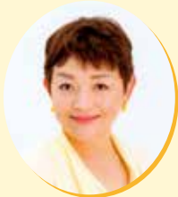
講師 藤田弓子氏 (女優)