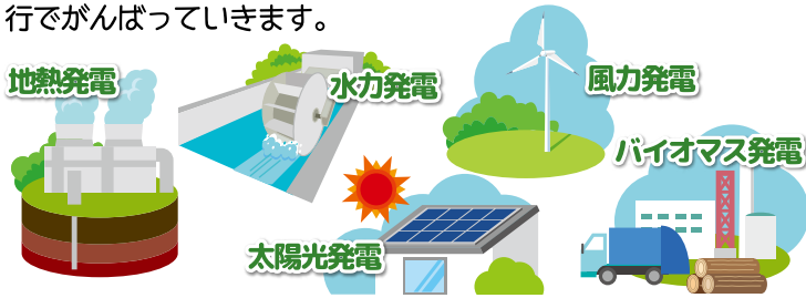
これからの利用が期待される「分散型」の再生可能エネルギー

恒電社では、「電気を自分で作って使う」これをわかりやすく「自電自足 ® 」と呼ぶ造語を作りました。実は商標も取得したのですが、自電自足 ® の生活を始めている人・計画している人、皆に自由に使ってもらいたいと考えています。手前味噌ですが、皆さまの将来の幸せのために、恒電社がお手伝いできたら嬉しいと心底思っています。まずは伊奈町から、2019年も有言実行でがんばっていきます。