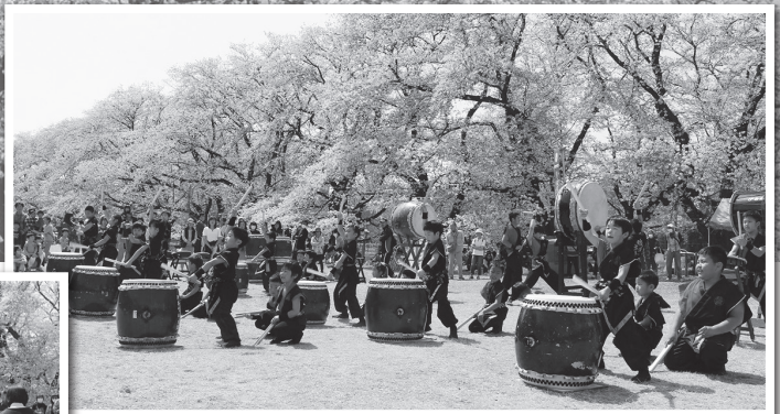
※写真は昨年のものです。