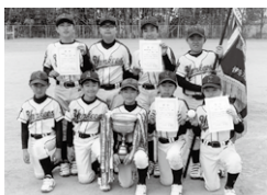
Aクラス 優勝 小針ヤンキーズ