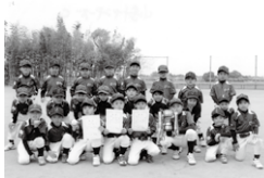
Cクラス 優勝 小針ヤンキーズ