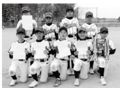
Bクラス 優勝 小針ヤンキーズ