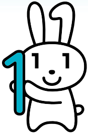
マイナンバーキャラクター 「マイナちゃん」

令和2年2月から、全国のコンビニエンスストアに設置されているキオスク端末（マルチコピー機）で、証明書が取得できるコンビニ交付サービスを開始する予定です。取得できる証明書は「住民票の写し」「印鑑登録証明書」の2種類です。