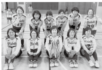
▲フレンズ・サクラ