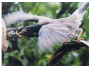
写真「親子の絆」 作:田中 義秋

作品を募集します 7月号で町民のみなさんからの作品を掲載します。秘書広報課までお送りください。 募集作品 俳句・短歌・写真・工芸・書道 応募締切 5月21日(休) ※作品の応募状況により掲載できない場合がありますのであらかじめご了承ください。