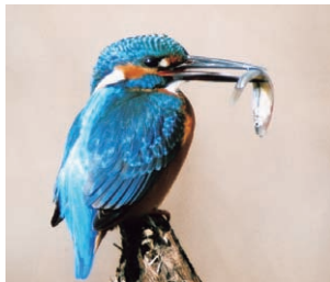
◆写真 「コバルトブルー！ カワセミ」 作：田中 義秋

薔薇の木は 香と花愛でる 声聞きたしと 「コロナ」去る日を 園に待ちいむ 藤元 美代栄