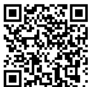
▲埼玉県ホームページ

子を自分の家庭に迎え入れて温かい愛情と理解を持って養育して下さる方を「里親」といいます。里親になるには、一定の要件を満たしていれば、特別な資格は必要ありません。詳しくは、埼玉県ホームページ「里親制度を知っていますか？」をご覧ください。 ☎ 子育て支援課 ☎2160