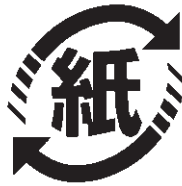
▲紙リサイクルマーク