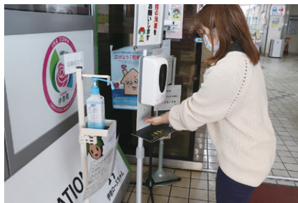
▲役場入口に設置された手指消毒スタンド

新型コロナウイルス感染症対策として消毒液等の購入、避難所における衛生環境整備のため、自動ラップ式トイレの購入等を行います。