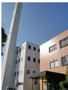
▲ 伊奈町クリーンセンター