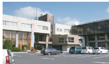
▲ 現在の伊奈町役場庁舎

新庁舎整備に伴う敷地拡張のための用地買収および基本設計実施のための事前調査等を行います。