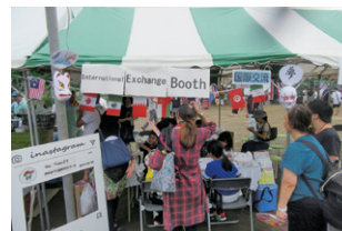
▲ 伊奈まつりの国際交流ブース

外国籍の住民と相互理解を深めるための国際交流コーナーの設置や交流事業を実施し、外国人との共生や国際交流の機会の充実を図ります。