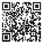
▲伊奈町納付サイト

また、スマートフォンやタブレットを使用し、クレジットカードやネットバンキングで納付できるようになりました。納付書に記載されているバーコードを読み取ることで、いつでもどこでも簡単に納付ができます。詳しくは「伊奈町納付サイト」をご覧ください。