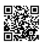
▲都市計画法の改正について

り、市街化調整区域内の浸水ハザードエリアにおいて、住宅などの開発許可が厳格化されます。詳しくは、町ホームページをご確認ください。 ☎ 都市計画法課内 2426