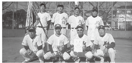
二部 優勝 メガ・ジャイアンツ 準優勝 栄64