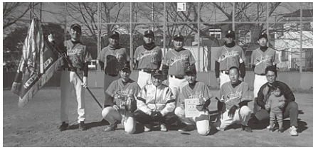
一部 優勝 スタークラブ 準優勝 プラスト