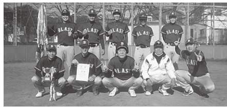
一部 優勝 プラスト 準優勝 パンサー