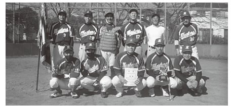
三部 優勝 細田山マスターズ 準優勝 キングス