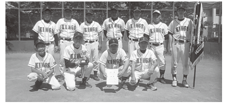
三部 優勝 キングス 準優勝 ファイブロータース