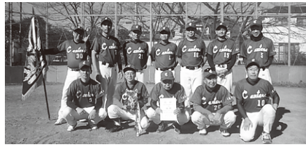
二部 優勝 伊奈センターズ 準優勝 メガ・ジャイアンツ