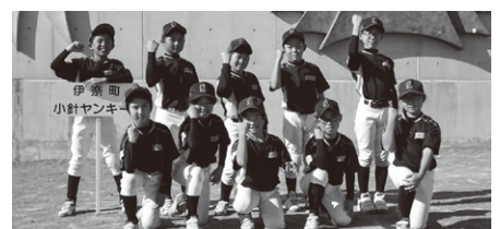
Cチーム 優勝 小針ヤンキーズ