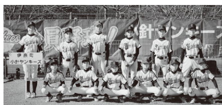
Aチーム 優勝 小針ヤンキーズ