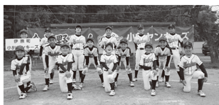
Bチーム 優勝 小針ヤンキーズ