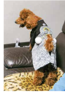
写真「アイドル」 作：田川 昭夫

◆俳句◆ 夏花火 空に見事な 輪を描き 稲雀 まばたきする間に 雲の中 五月晴れ 待ちいし花の 咲き初めし 五〇〇株バラ 香りほのかに 藤元 美代栄 夏の宵 おばあちゃんと 孫の声 只呼んだだけ おちゃめな瞳 石川 益江