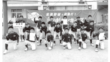
Cチーム 優勝 小針ヤンキーズ