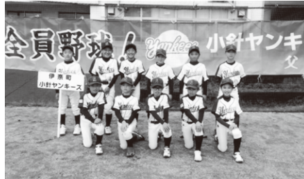
Bチーム 優勝 小針ヤンキーズ