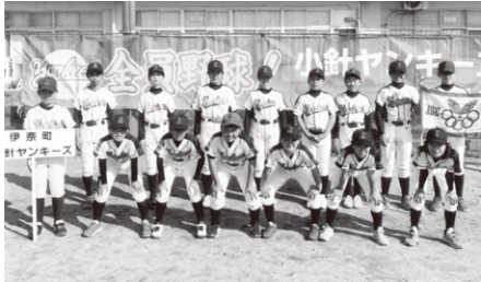
Aチーム 優勝 小針ヤンキーズ

『広報いな』令和4年8月号で掲載いたしました記事について、写真の誤りがありました。改めまして、正しい写真を掲載するとともに、お詫びして訂正いたします。