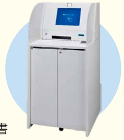
図 DX 推進・新庁舎整備室内 2612