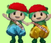
伊奈町マスコット 「伊奈ローズくん」 「伊奈ローズちゃん」