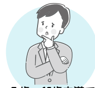
5歳～65歳未満で 基礎疾患のある方