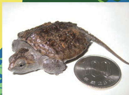
カミツキガメの幼体