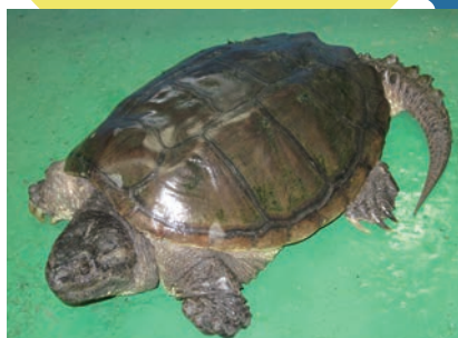
甲羅の色や形は生息環境によって異なります