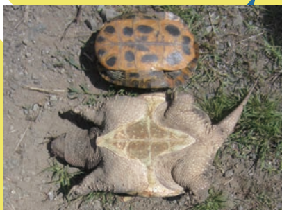
腹側の甲羅は小さく、ひし形 (上：ミシシippアカミミガメ、 下：カミツキガメ)