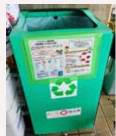
※回収ボックスのイメージ