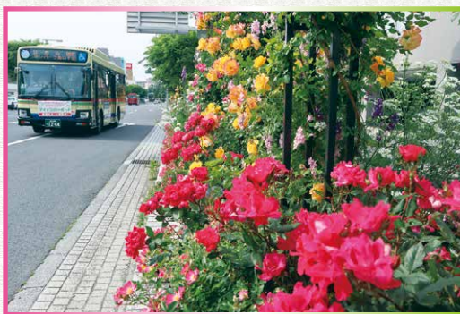
山梨県宇都部市 宇部市平和通り (シンボルロード)