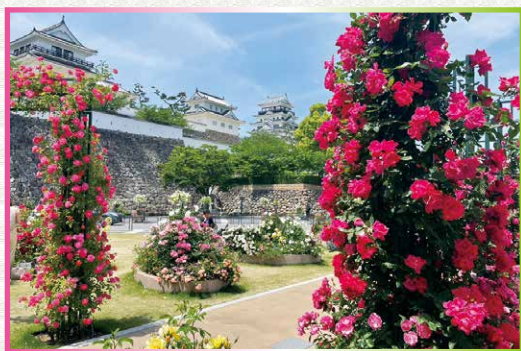
広島県福山市 JR福山駅北口スクエア