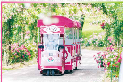
鹿児島県鹿屋市 かのやばら園