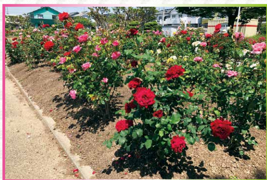
愛知県西尾市 戸ヶ崎公園