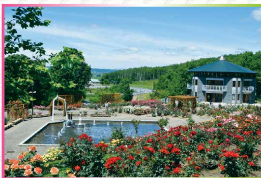
北海道秩父別町 ローズガーデン ちっぷべつ