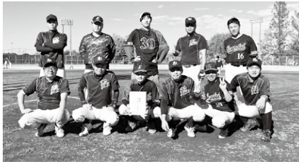
◎Aグループ 優勝 SCANDAL・バルセロ伊奈 (合同チーム) 準優勝 泉ブラザーズ、バーリーズ、MORITA ※3チーム同率。

町野球連盟 秋季野球大会 令和6年9月1日～11月17日 町制施行記念公園野球場