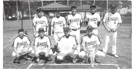
◎二部 優勝 イーグルス 準優勝 キングス

町野球連盟 秋季野球大会 令和6年9月1日～11月17日 町制施行記念公園野球場