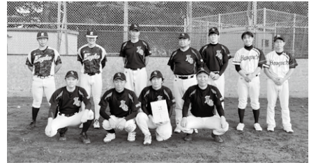
◎Bグループ 優勝 伊奈町役場 準優勝 デビルキラーズ