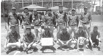
◎一部 優勝 ブラスト 準優勝 メガ・ジャイアンツ

町ソフトボール協会 町長杯争奪大会 令和6年6月30日～7月28日 町制施行記念公園野球場