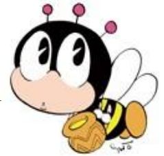
生涯学習のマスコット “マナビイ”

“子ども大学あげお・いな・おけがわ”とは、 地域の大学や自治体等が連携し、 子どもの知的好奇心を刺激するさまざまな講義や 体験活動を行う“子どものための大学”です。